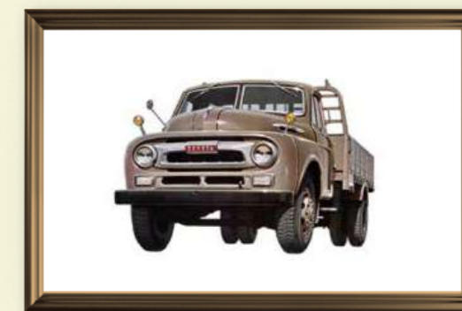
写真はトヨタFA60型6トン積み

発明王豊田佐吉の長男豊田喜一郎はゼロから自動車産業を起こしたことから、国産自動車の父と呼ばれる。1935年に登場したトヨタ初の量産ガソリンエンジンA型は、シボレーのエンジンを模したものであった。その後部品の内製化に成功したトヨタはインチからミリに変更した、B型エンジンを製造していた。当時のトヨタの主力は乗用車ではなくトラックであった。当時の物流は、5トンから6トンが主流でガソリンエンジンに自信を持つトヨタは高いシェアを誇っていた。トヨタトラックの完成形ともいえるのが、1954年発売、F型ガソリンエンジン搭載のFA型トラックであった。もともとトヨタは、トラックのデザインについてもこだわりを持っていたが、一目でトヨタと分かるデザインとクラウンと同等の最高速度を誇るFA型は好評であった。