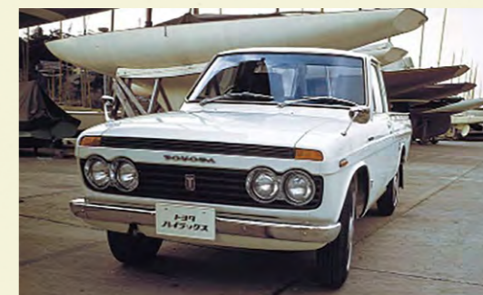
写真は【RN10型ハイラックス標準ボディ】

1966年当時小型トラック市場は「トヨエース」、「ダイナ」、「スタウト」をラインナップするトヨタの独壇場であった。1967年にはダメ押しともいえる「ハイエース」の投入により市場を独占していた。しかし「1トン積みボンネットトラック」市場は「ダットサン・ブルーバード」のトラック版ともいえる「ダットサントラック」の独壇場であり、小型トラックでトップシェアを持つトヨタも「コロナピックアップ」や「ライトスタウト」では対抗できず、同年業務提携した日野が製造していた「プリスカ」で攻勢に出ることになる。「プリスカ」はピストリングからネジ1本に至るまでトヨタのサプライチェーンの部品に置き換えられ、エンジンは日野製「GR100型」55馬力であったがトヨタの意地ともいえる8馬力のパワーアップが図られ最大出力63馬力を有していた。外観は同様であるが「トヨタ・プリスカ」として市場に投入された。1968年フルモデルチェンジを期に車名を「ハイラックス」に改称した。同時期投入の「ハイエース」が1350cc・「3P型」エンジンであったのに対し「ハイラックス」は「コロナPT40」と共通の1500cc・「2R型」70馬力エンジンを搭載し、乗用車ムード満点の設計としていた。テレビCMに水前寺清子を採用、各社が苦戦する「ダットサントラック」の牙城に切り込んで行くことになる。その後も、「ダットサントラック」の好敵手として、ともにピックアップトラックブームを牽引したことは周知の事実である。