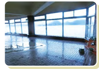
温泉に入りながら洞爺湖が一望