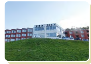
北海道有珠郡壮瞥町字洞爺湖温泉41 (最寄りICから25分の好立地)

北海道屈指の洞爺湖温泉街にほど近く、窓からは洞爺湖が一望、有珠山など自然に囲まれたリゾートマンションです。